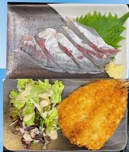
活アジランチ(刺・揚)